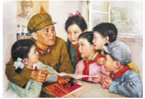
江苏人民出版社1963年出版 作者 李慕白

两百多种以“学雷锋”为主题的宣传画和年画，出版时间跨度从上世纪60年代至90年代，内容涵盖了各个历史阶段。一些藏家和媒体夸我是国内民间雷锋精神专题收藏的集大成者，我听自是诚惶诚恐，当作勉励。 怎么“把红色资源利用好，把红色传统发扬好，把红色基因传承好”？这是我一直在思考的问题，也一直在探索和实践着。2015年3月5日，应江西省抚州市委宣传部等单位的邀请，我在抚州市博物馆举办了为期两个月的“雷锋专题红色藏品展”。一共展出了300多件文献和实物，当中既不乏李慕白、金雪尘、金梅生、谢之光、张乐平等名家精品，也有书包、针线包、书签等小物件，展现出来的雷锋形象如此丰满，展品又是如此接地气，许多市民欣赏了展览后都勾起了美好的回忆，他们感慨地称道：“看到了这些似曾相识的画面和实物，好像穿越了历史时空，很久没有这样感动过。”展览结束后，我还举办了相关主题讲座，就雷锋精神时