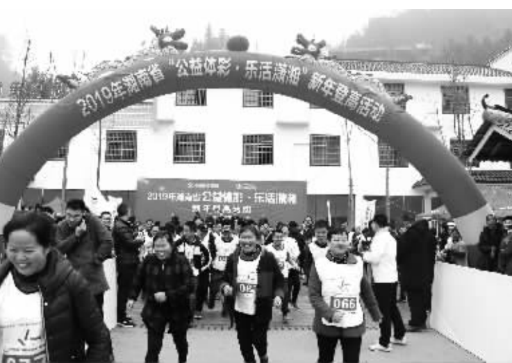
2019年湖南省“公益体彩 乐活潇湘”新年登高活动现场,村民欢乐起跑。

开幕式前,现场举行了以“公益体彩 乐善人生”为主题的推地推活动,开展了“足下生风”“手舞足蹈”“头球争顶”三个挑战游戏,不仅运动员们积极参与,不少当地村民也加入到了挑战的队伍中。尽管只是三项趣味小游戏,大家却玩得不亦乐乎,挑战成功的选手均获得