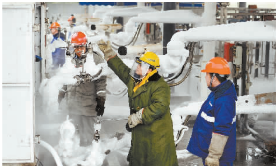
1月15日,长沙县望仙东路新奥燃气储配站,工作人员在对采购来的天然气进行卸装作业。