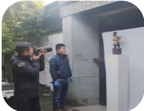
木雕点交现场进行原始信息采集