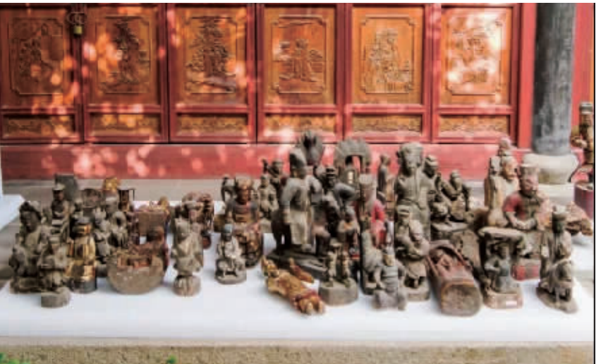
倪先生从收藏第一件木雕人物像到现在,已有四五年时间,收藏木雕像约七十多件,几乎全部捐赠。木雕人物形象生动,姿态各异,种类繁多。