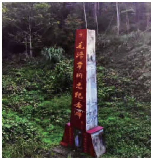
毛泽覃的牺牲是悲壮的。

文艺作品尤其是纪录片并非浅尝辄止、浮光掠影,也应坚决杜绝虚无历史、泛娱乐化、泛物质化。《故园长歌》树立了正确的创作理念,坚持把社会效益放在首位,讲品位、讲格调、讲责任。作为国内年轻用户占比最高的网络视频平台,芒果TV一直秉承着弘扬主流价值观的媒体责任,贴近青年群体、传递社会核心价值。2018年3月,芒果TV推出献礼全国两会的特别节目《我的青春在丝路》,同年7月推出纪念建党97周年特别报道《赶考路上》,12月上线献礼改革开放四十周年新时代正能量纪录片《此间的奋斗》,在这些有着特殊时代意义的国家重大节日和纪念节点,芒果TV以时代热点为表达契机,打造了一部又一部不断革新主旋律节目传播语态,推出了多样化视角和表达的纪录片。