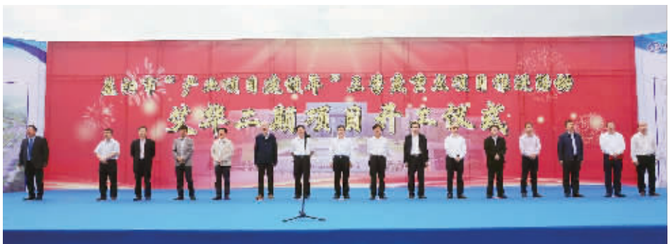
9月28日,艾华二期项目开工。

在“敞开大门”的同时,益阳也注重守好“门槛”,紧盯世界500强、中国500强、民企500强,引进了一大批有影响、上规模的产业项目和领军型龙头企业。1-11月份,全市重点跟进在谈的“三类500强”企业投资项目有40多个。截至目前,华为智慧城市建设及配套产业链(软通动力)项目、三一重工摊铺机生产项目、中联重科投资建设的工业3.0升级4.0产业园项目等22个项目签约落地,总投资146.8亿元,引进500强企业数量和质量均取得较大突破。22个落地项目中,装备制造、食品加工、能源开发、商业综合体等产业类投资项目19个,总投资111.8亿元。目前,全市共有30个项目仍在跟进洽谈,意向投资830亿元。