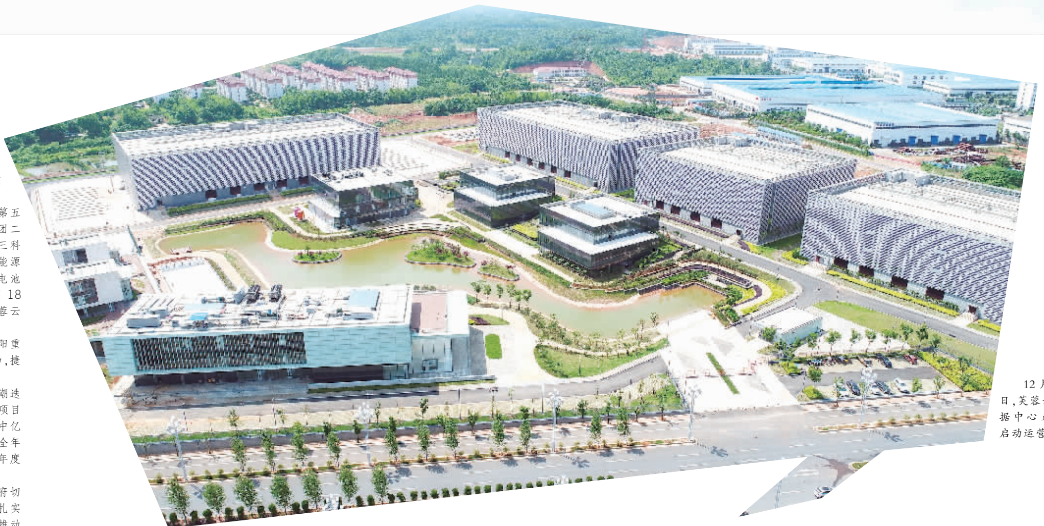
12月18日,芙蓉云数据中心正式启动运营。