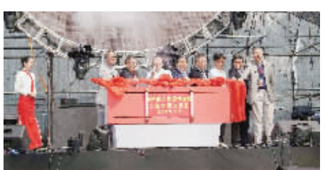
9月28日上午,益阳东部新区文化旅游度假区启动“天意木国”开馆仪式举行。

由珠海日东集团打造的天意木国项目拟总投资60亿元,主要以奇根珍木为主体元素,打造成集旅游、文化、艺术、养生、健康、教育为一体的文旅综合体。项目规划了奇根珍木展示区、一带一路木博园、五星级木文化主题酒店、红木别墅群、艺术交易中心等一系列木文化主题内容。项目致力于将益阳打造为中国乃至世界根雕艺术文化的集聚地和展示中心,是全市乃至全省文旅产业标杆项目及标志性工程。项目建成后,将成为益阳文化旅游的新地标、湖南的第四张名片、潇湘第九景,以及中国最具特色的旅游目的地之一。