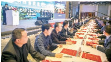
10月23日下午,在第二届生态农业智慧乡村互联网大会暨周立波诞辰110周年群众纪念活动中,益阳市举行重点项目集中签约仪式。

9月28日,根雕主题文旅项目天意木国在益阳东部新区鱼形山旅游度假区正式启动。当天开业的一期项目为奇根珍木展示区,占地面积286亩,投资2.8亿元。展示区收藏有上万件大型根雕作品和数百件大型根材,由世界各地收集的枯木断根加工创作而成,展品规模之大、品种之多、工艺之美,在业内首屈一指。展示区将成为文化传承和科普教育的艺术基地。