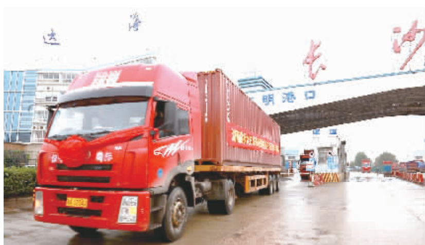
市场采购首单贸易出口。

站在新的历史起点上,高桥大市场正以海纳百川、兼收并蓄的广阔胸怀,迎接新一轮开放热潮!