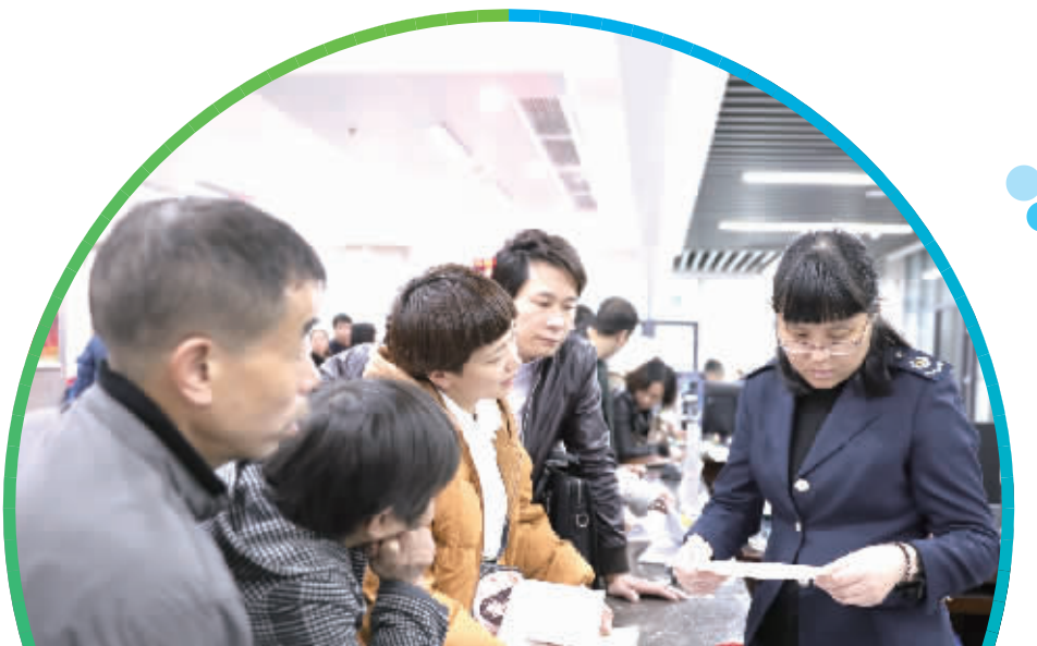
市民正在办理税务登记。