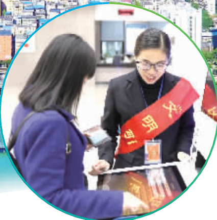
郴州市政务服务中心便民服务。