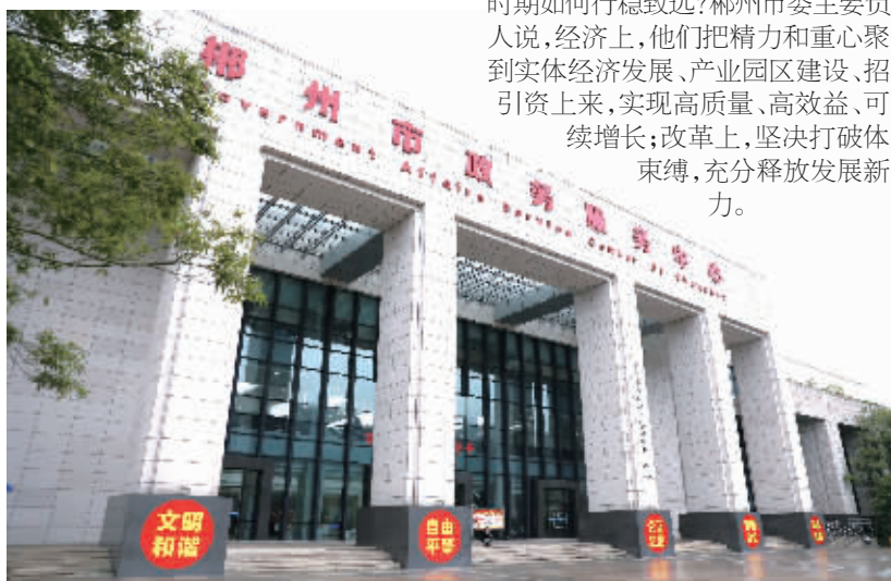
郴州市政务服务中心。

同时，启动交通大建设、城市大提质、产业大转型、民生大改善、作风大转变等五大工程，