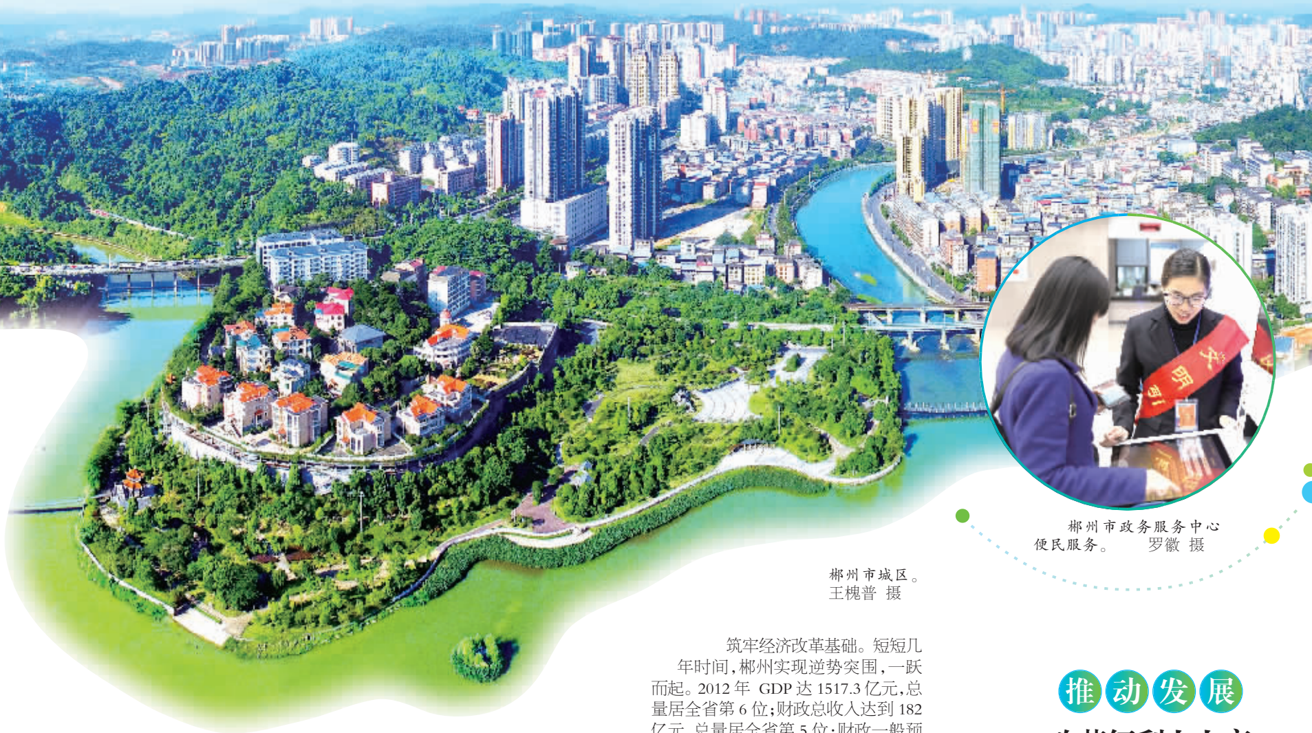
郴州市城区。

截至2018年8月底，郴州共有市场主体22.2万户，其中企业4.8万户，比改革前增长139%；个体工商户17.4万户，比改革前增长53%。