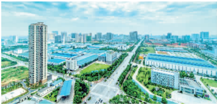
产城融合的湘潭高新区是一片创业福地。

同时,湘潭高新区还建成创业苗圃、科技孵化场地40万平方米、科技企业加速器25万平方米,设立1000万元创业扶持基金,搭建起全市首家科技金融服务中心,引