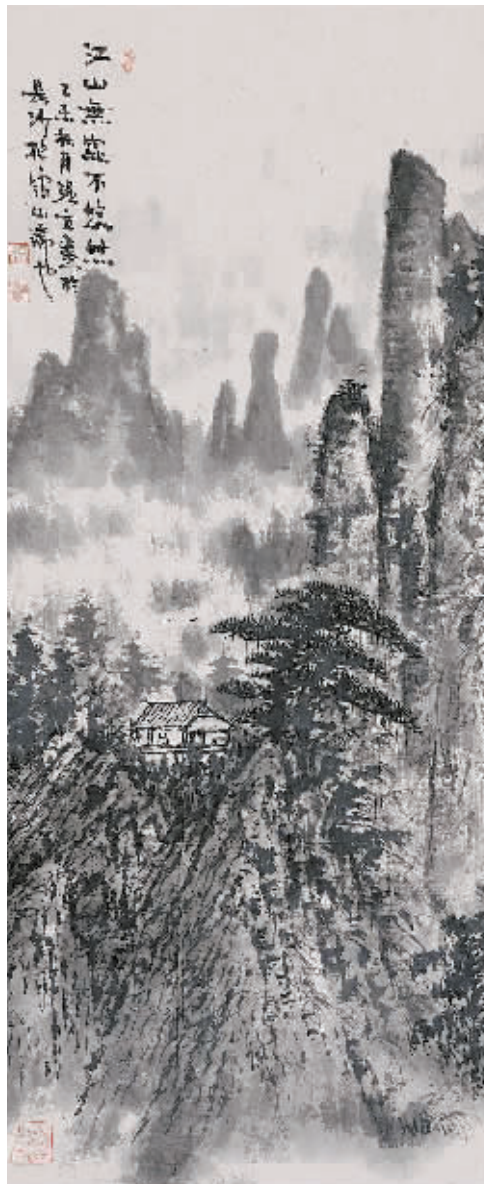
江山无处不悠然(局部) 杨强立