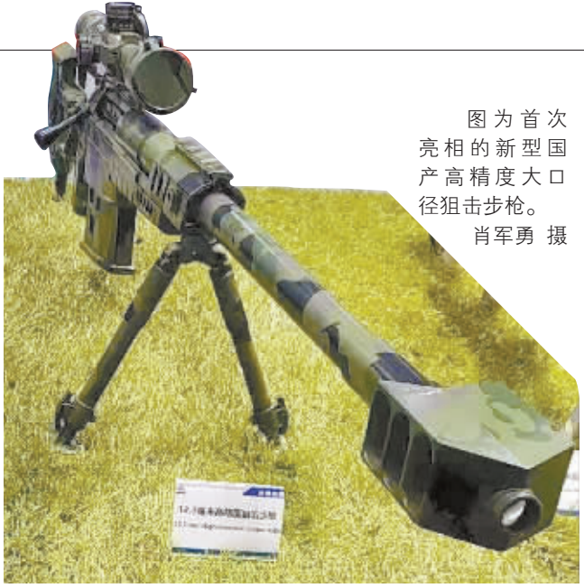
图为首次亮相的新型国产高精度大口径狙击步枪。

除了高精度远距离的狙击枪，一款湖南产12.7毫米口径“反装甲”子弹也首次亮相。这款12.7毫米钨芯脱壳穿甲弹，是一种可以在狙击步枪上使用的步兵用反装甲弹药。由于金属钨是自然界中硬度非常高的一种金属，可以有效击穿金属装甲和坚固防御工事，打击效果惊人。