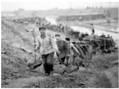
1978年1月8日,桃源县防洪大堤一派热火朝天的建设景象。

湖南因水得名,水是湖南最明显的地理特征,也是最大的省情。防洪大堤是抵御洪水的重要工程措施,是人民群众的“保命堤”。改革开放以来,我省持续大干水利,防洪能力明显提升。近十年与上世纪90年代相比,全省年均因洪涝灾害死亡人数从415人下降到36人,洪涝灾害年均损失率从8.56%下降到0.72%。近年,随着生态文明理念的确立,越来越多的城市开始对防洪大堤进行综合改造,在保障防洪作用的前提下,构建集景观、休闲、交通于一体的“城市绿道”,形成一道道靓丽的风景线。