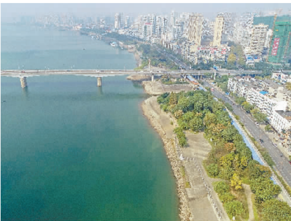
11月4日,常德市沅水大桥段,防洪大堤绿意盎然。