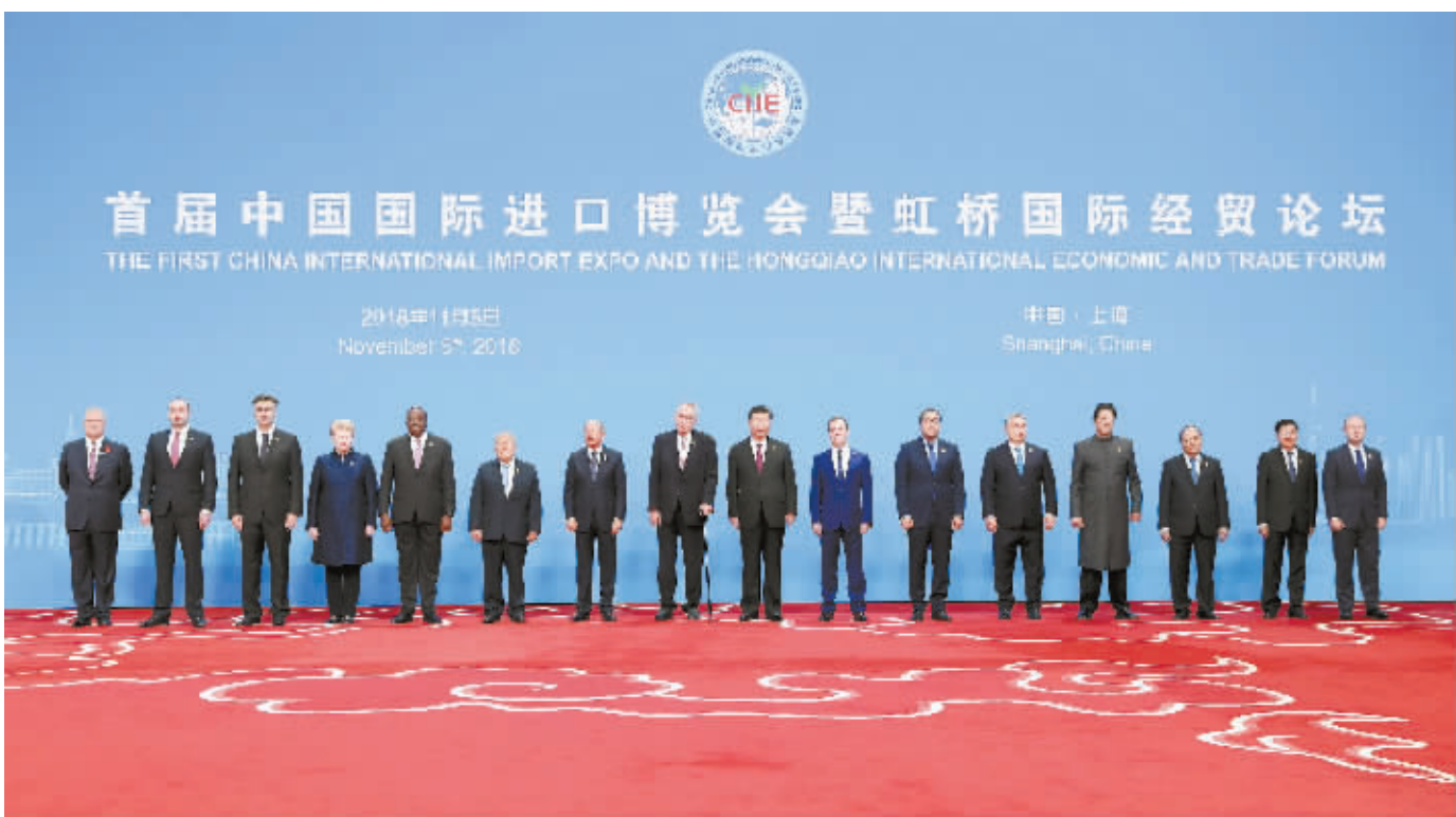
开幕式前，习近平同外方领导人集体合影。