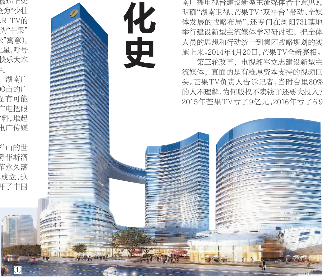
图①马栏山视频文创产业园之芒果大厦效果图。 图②2008抗冰救灾晚会现场，李谷一演唱歌曲《风雪无惧朝前走》。 图③华人华侨春晚。 本版图片均为资料图片

这支“中华传媒第一股”成就了马栏山的世界之窗、海底世界、国际会展中心、圣爵菲斯酒店等组成的影视文化城。2000年，金鹰节永久落户长沙，同年，湖南广播电视台挂牌成立，这是全国第一个省级广播电视台集团，拉开了中国广电行业集团化改革的序幕。