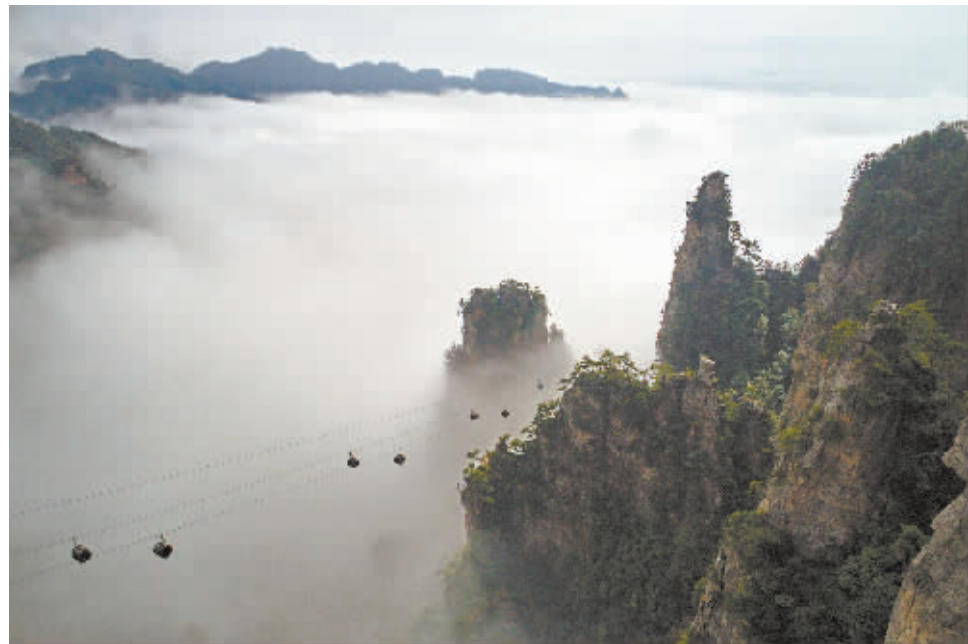
通往仙境的路(优秀奖)