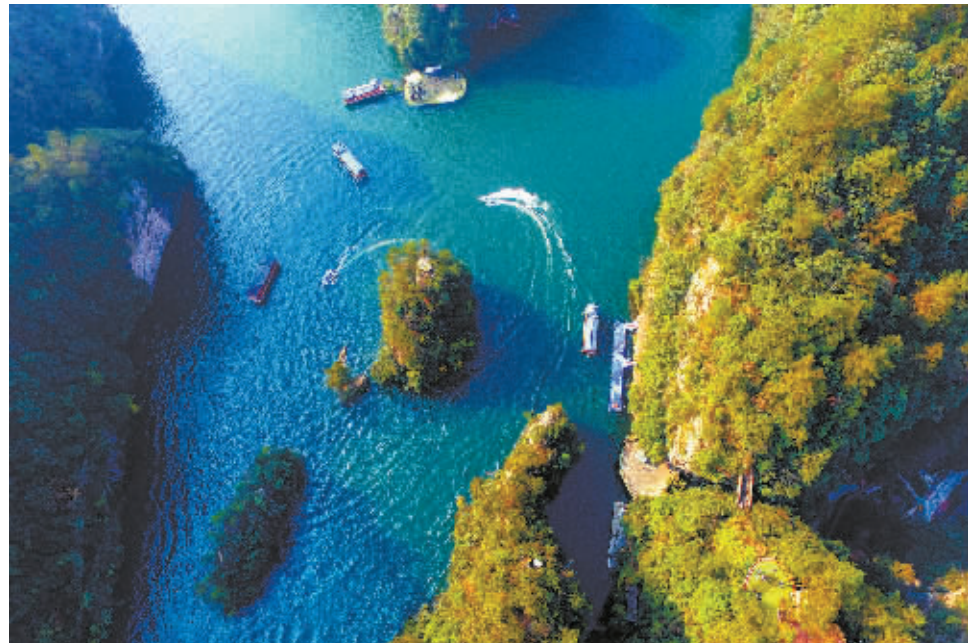
水上高尔夫(优秀奖)