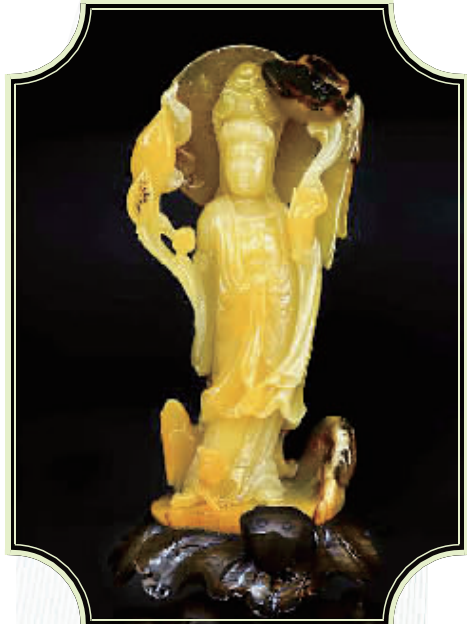
临武通天玉雕刻作品。