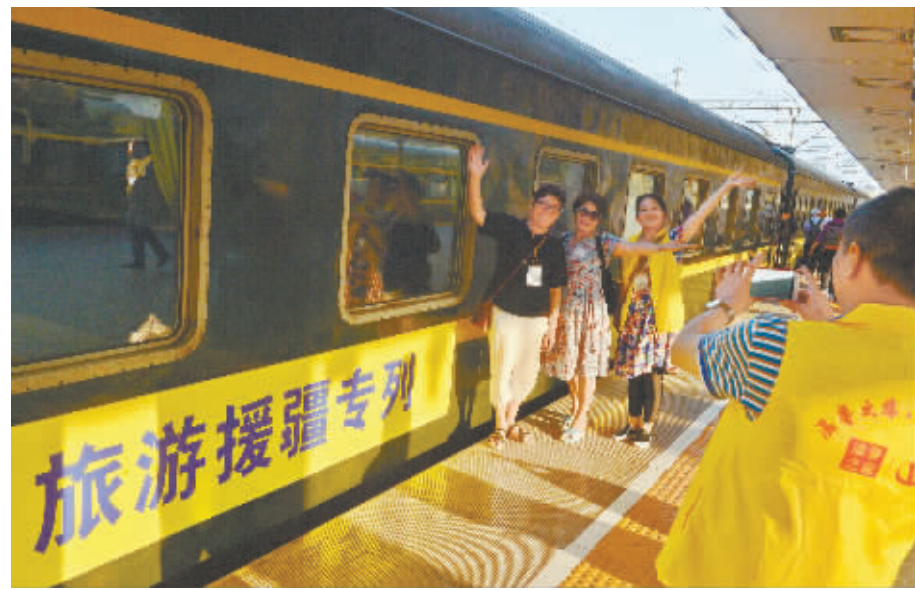
5月16日,长沙火车站,乘车旅客在“湘疆号”旅游援疆专列前留影。

湖南日报5月16日讯(记者 孟姣燕)今天,2018年“天山梦·湘吐情”湖南人游吐鲁番旅游推介会暨“湘疆号”旅游援疆专列启动仪式在长沙举行。