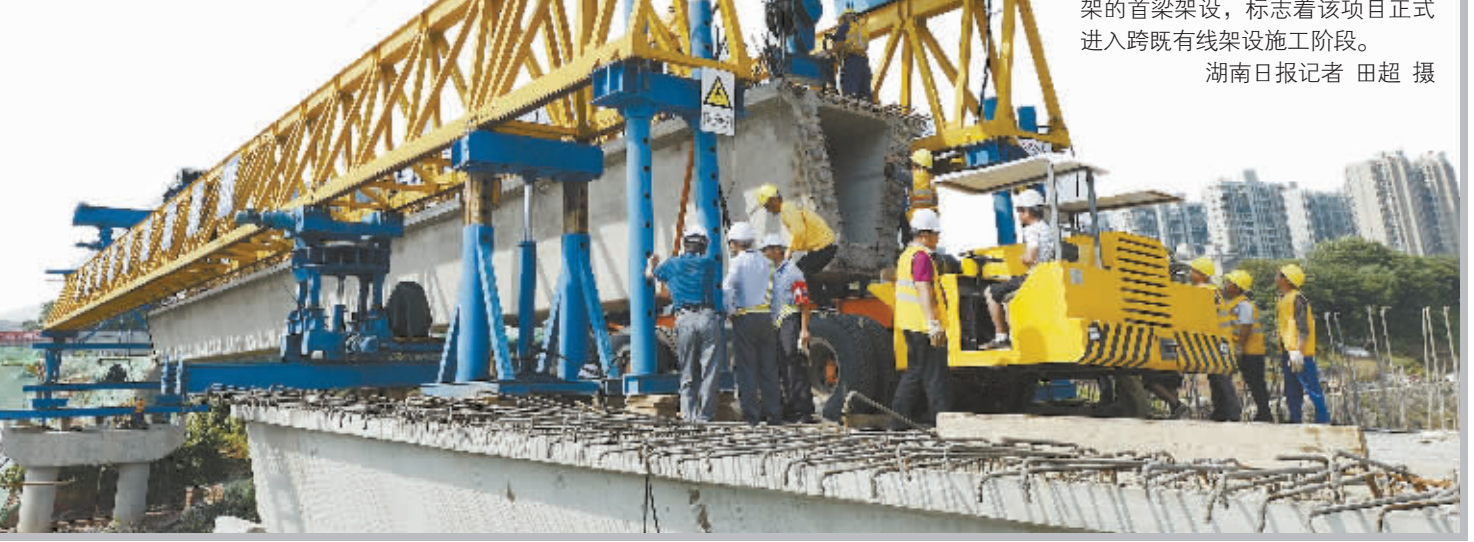
5月16日上午,中铁二十五局集团长沙市曙光路(车站路-雅塘冲路)项目部施工现场,一片40米长、重150吨的箱梁成功架设在项目跨京广铁路辅道桥2#墩上并完成安装。