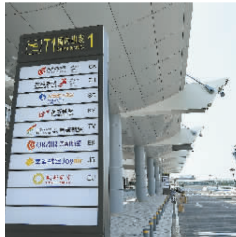
5月11日，长沙黄花国际机场T1航站楼改造全面完成，将于5月16日恢复使用。

另据省机场管理集团介绍，机场还将把原有的4个停车场进行重新设计、规范，方便自驾车旅客停车、找车。