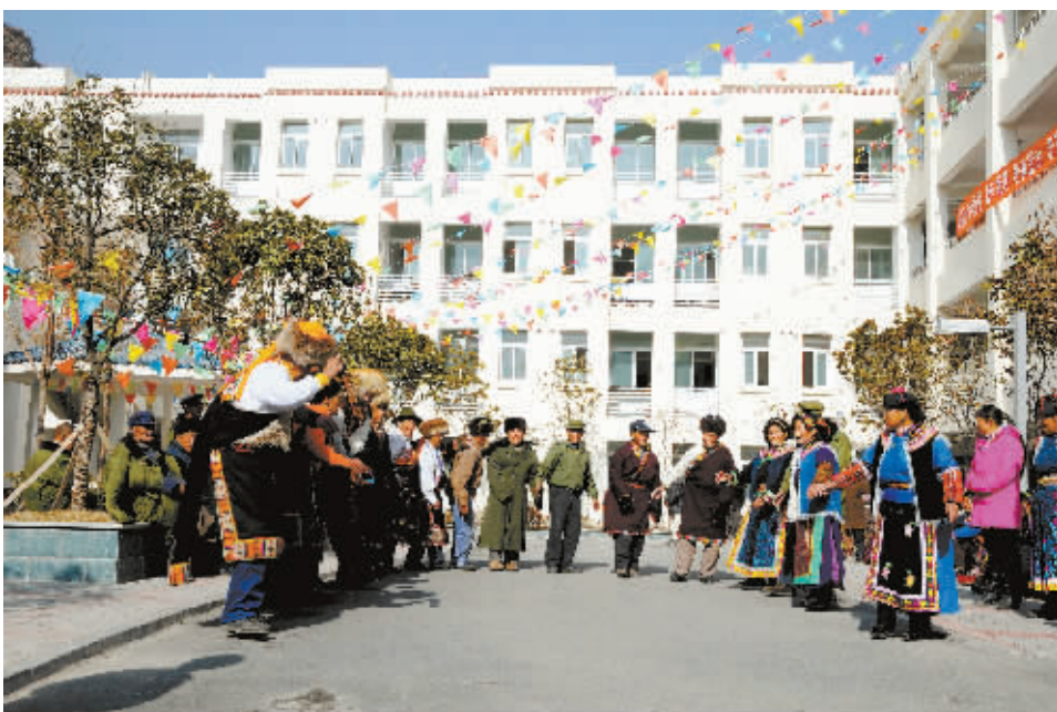
湖南对口援建的理县福利中心。2010年5月开始入住，中心现有75名老年人入住，闲暇之余，老人们聚在一起，跳起欢乐的锅庄。（资料图片）

从2008年8月到2010年10月，除了4个月的冰冻期无法施工，湖南援建队在18个月内，共投资逾20亿元，完工交付项目99个，包括医药、学校、道路、水利等，当地生产生活迅速恢复。