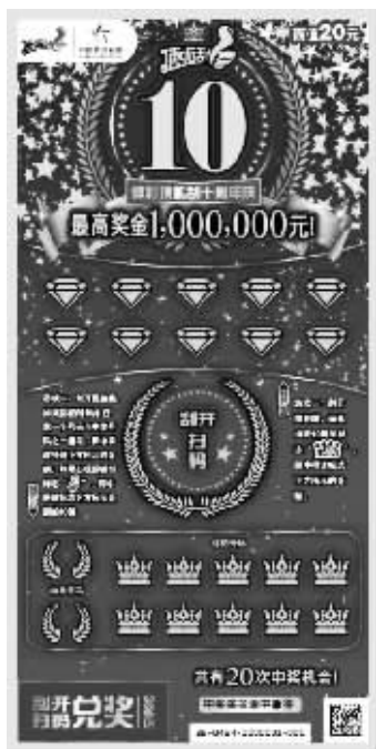
顶呱刮十周年庆 20元票样

标志下方所示的金额。中奖奖金兼中兼得。 10元面值“体彩顶呱刮十周年庆”共有12次中奖机会，打破常规基本奖设奖方式，头奖达50万元，更多500元奖金。刮开覆盖膜，如果你的号码中任意一个号码与中奖号码之一相同，即中得该号码下方所示的金额；如果出现10周年标志，即中得该标志下方所示金额的5倍。中奖奖金兼中兼得。 20元面值“体彩顶呱刮十周年庆”共有20次中奖机会，头奖100万元。打破常规基本奖设奖方式，有数百万大奖。游戏规则为：游戏一，刮开覆盖膜，如果出现10周年标志，即中得该标志下方所示的金额；游戏二，刮开覆盖膜，如果你的号码中任意一个号码与中奖号码之一相同，即中得该号码下方所示的金额；如果出现顶呱刮标志，即中得该标志下方所示金额