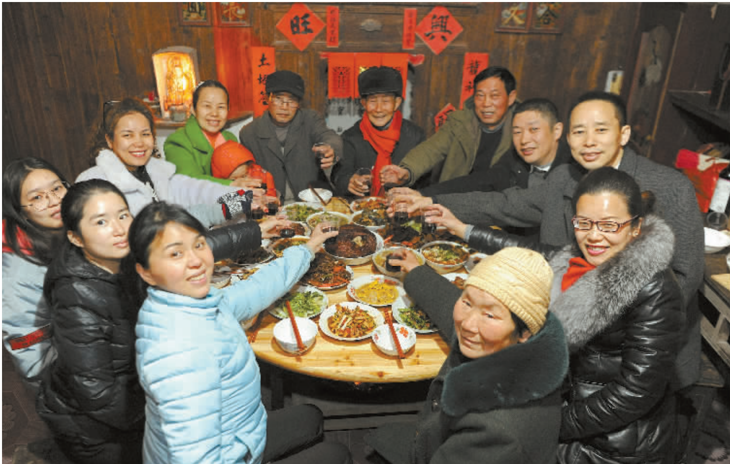
2月10日18时30分，一大家子人一起碰杯庆祝，吃起了团圆饭。