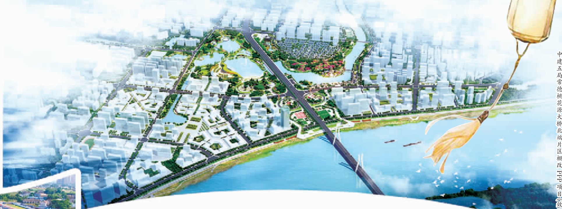
中建五局常德桃花源大桥北端片区棚改PPP项目(效果图)

中建五局以加快发展、提质发展、安全发展的优异成绩,向党、向时代、向人民交出了一份靓丽的答卷!