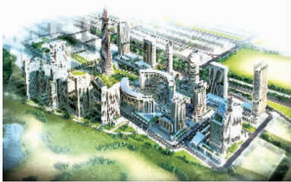
中建五局埃及新行政首都项目,建筑高度100米,合同额约10.86亿元(效果图)。

在贯彻落实党的十九大精神的专题党课中,五局响亮地提出:用发展的业绩,检验贯彻落实党的十九大精神的成效。