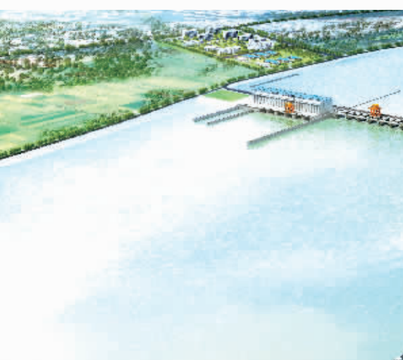
中建五局承建中建系统第一个大型水利项目——江西赣江井冈山航电枢纽工程与九江港彭泽港区红光作业区综合枢纽码头一期工程PPP项目。