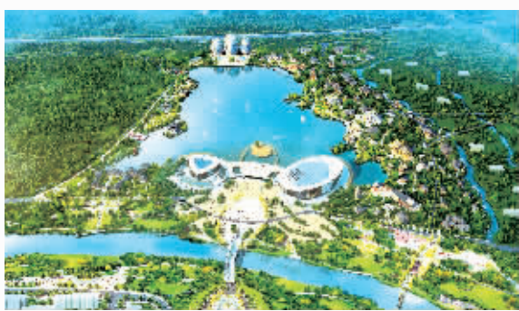
中建五局目前体量最大的特色小镇项目:江西赣州市南康家居小镇PPP项目(效果图)。