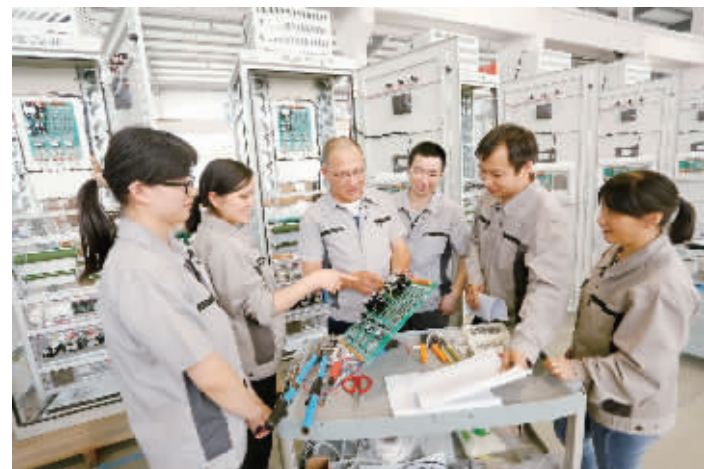
中科电气科研团队。