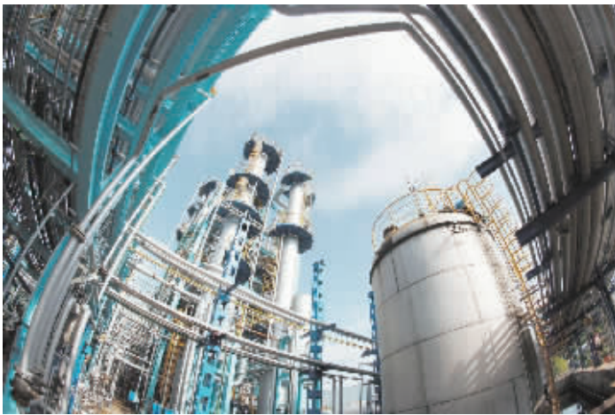
百利科技生产场景。

中科电气研制的空芯铜管电水冷型方圆环连铸电磁搅拌装置，填补了国内空白，被国家五部委授予国家重点新产品称号，成为国内目前唯一能生产此类产品的企