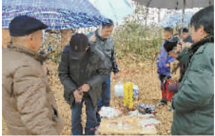
吴敏树后裔在吴敏树墓地祭拜。