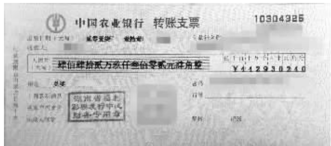
幸运的中奖彩票和兑奖支票