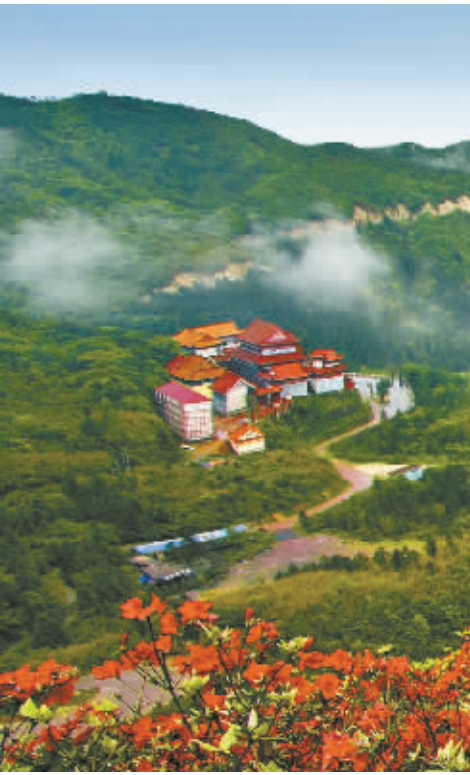
双牌县阳明山杜鹃花海。（资料图片）贺文胜 摄

妇，仍对《爱情宣言》记忆犹新：“今天，我们站在阳明山下……我们请阳明山作证，我们请红杜鹃作证，我们请蓝天白云作证，年年岁岁，此情永生不变。生生世世，此情沧海不移。时时刻刻，爱你永不分离！”