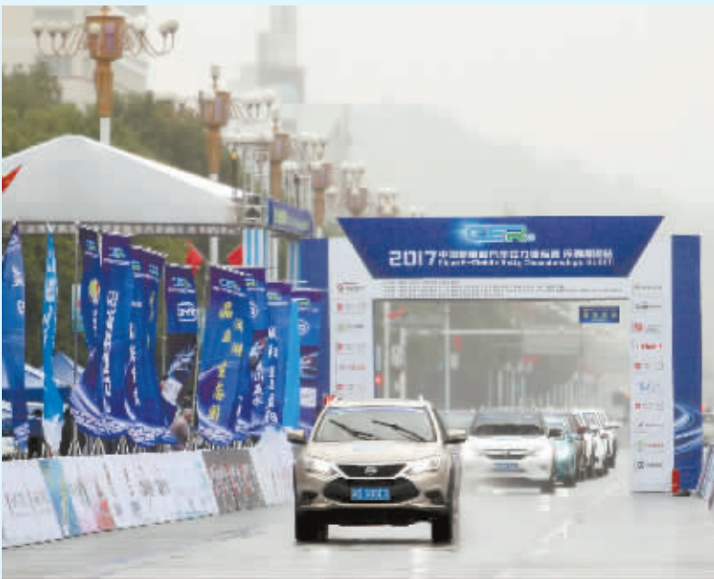
图为10月12日，益阳赛段比赛现场。