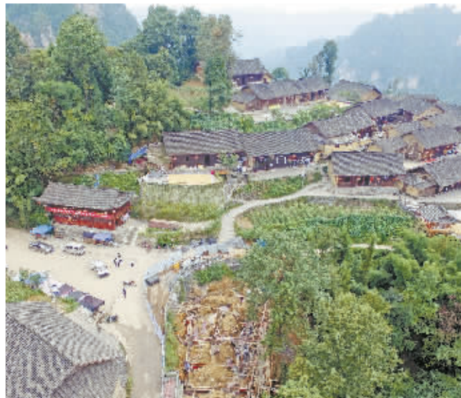
9月15日，花垣县双龙镇十八洞村，休闲长廊、观景台等设施正在加紧建设。在社会各界的帮扶下，该村发展了水果蔬菜种植、养殖、休闲旅游等多元化的产业，村民收入大幅增长，家家通上了自来水、用上了电。2017年初，该村整体脱贫。