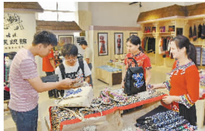
9月6日，江华瑶族自治县的中国社会扶贫网江华服务中心，游客在选购瑶族织锦。该中心是电商扶贫中心，专门推介、销售当地特色农产品。2016年，该县完成40个贫困村电商服务点建设，帮助村民通过电商平台销售农产品。