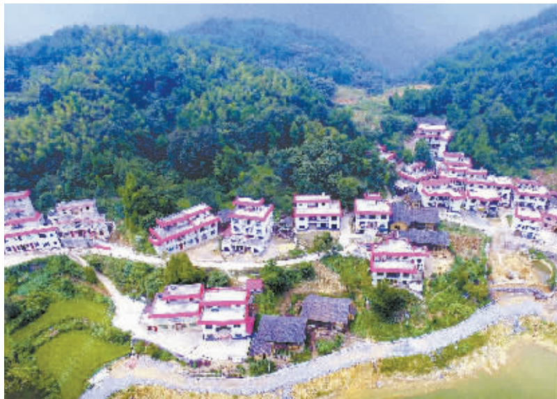
9月2日，焕然一新的隆回县岩口镇向家村。该村曾是贫困村。2014年，湖南华兴实业发展有限公司董事长向长江当选村委会主任后，投资1500余万元，改善基础设施，发展种植、休闲旅游特色产业，带领村民增收脱贫。2016年，该村人均纯收入达5000多元，贫困户全部脱贫。

展脱贫攻坚“七大行动”，因地制宜开展精准扶贫工作。不仅全省农村贫困人口从2012年底的767万人，降到2016年底的356万人，贫困发生率由13.43%降至6.36%，还创新出了“四跟四走”产业扶贫、“无抵押、无担保、基准利率”小额信贷扶贫、“互联网+社会扶贫”等扶贫开发新机制，为我省如期全面建成小康社会打下了坚实的基础。