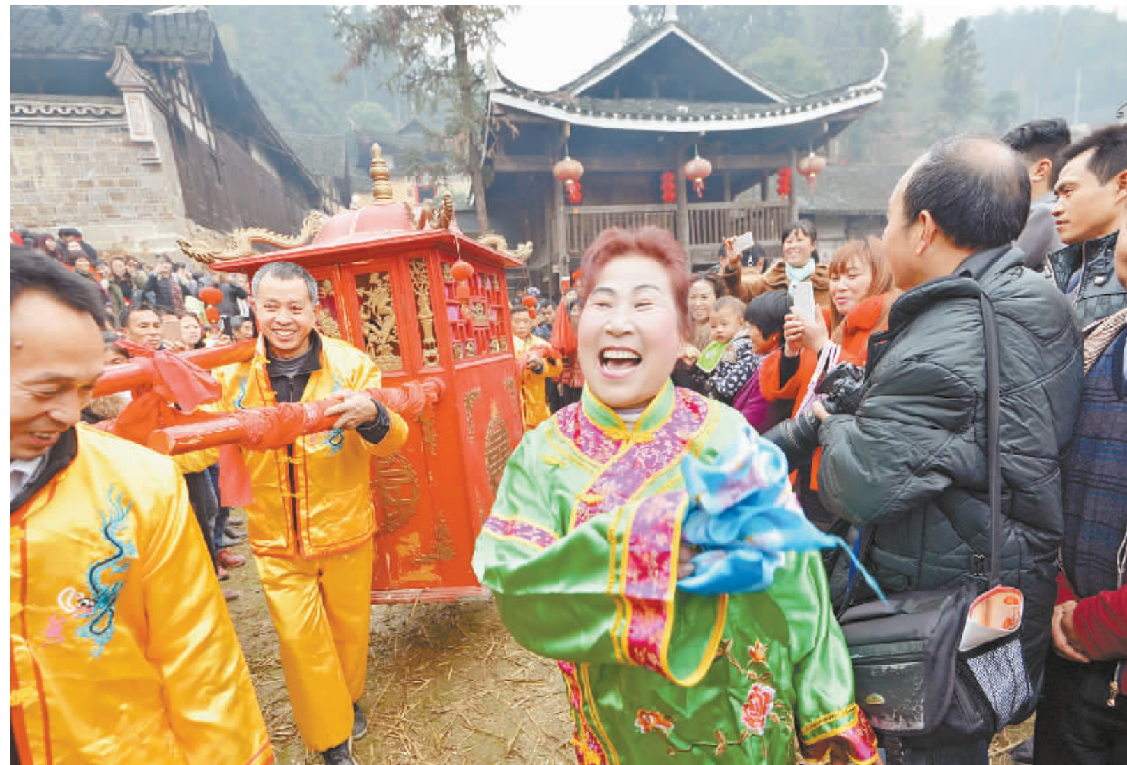
1月5日，溆浦雪峰山旅游景区，村民表演当地婚俗。该景区于2014年5月开发建设，旅游带动了景区所在的4个乡镇近10万农民增收，2300多贫困人口脱贫。