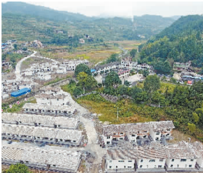
9月23日，建设中的龙山县召市镇辰柳易地脱贫安置区。该安置区占地82亩，计划安置易地搬迁贫困户93户381人。自2016年起，龙山县启动易地搬迁脱贫项目，将自然条件差、扶贫难度大的1.3万名贫困群众搬迁到自然条件相对较好的地方。