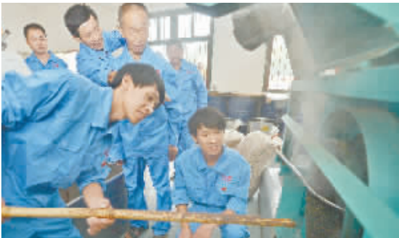
9月5日，平江县巨雄农副产品专业合作社，返乡创业的青年党员和社员交流榨油工艺。该合作社采取“党员+贫困户”的模式，建成3500余亩油茶、杉树林、猕猴桃等基地，带动31名贫困户增收。