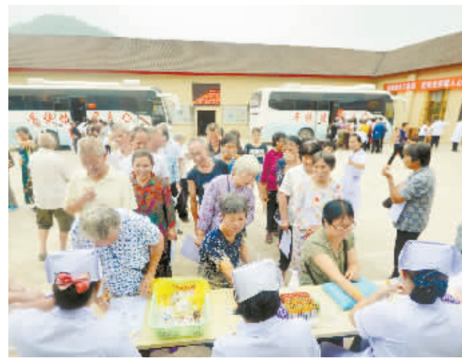
9月6日，娄底市娄星区人民医院的“健康快车”开进水洞底镇向红社区，为居民免费体检。自2014年9月开行后，“健康快车”已走遍该区11个乡镇，有效解决了群众，特别是贫困人群看病难、看病贵的问题。