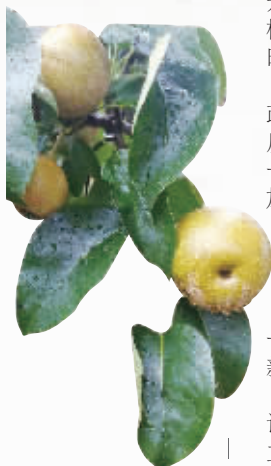
江华瑶山雪梨 香甜可口