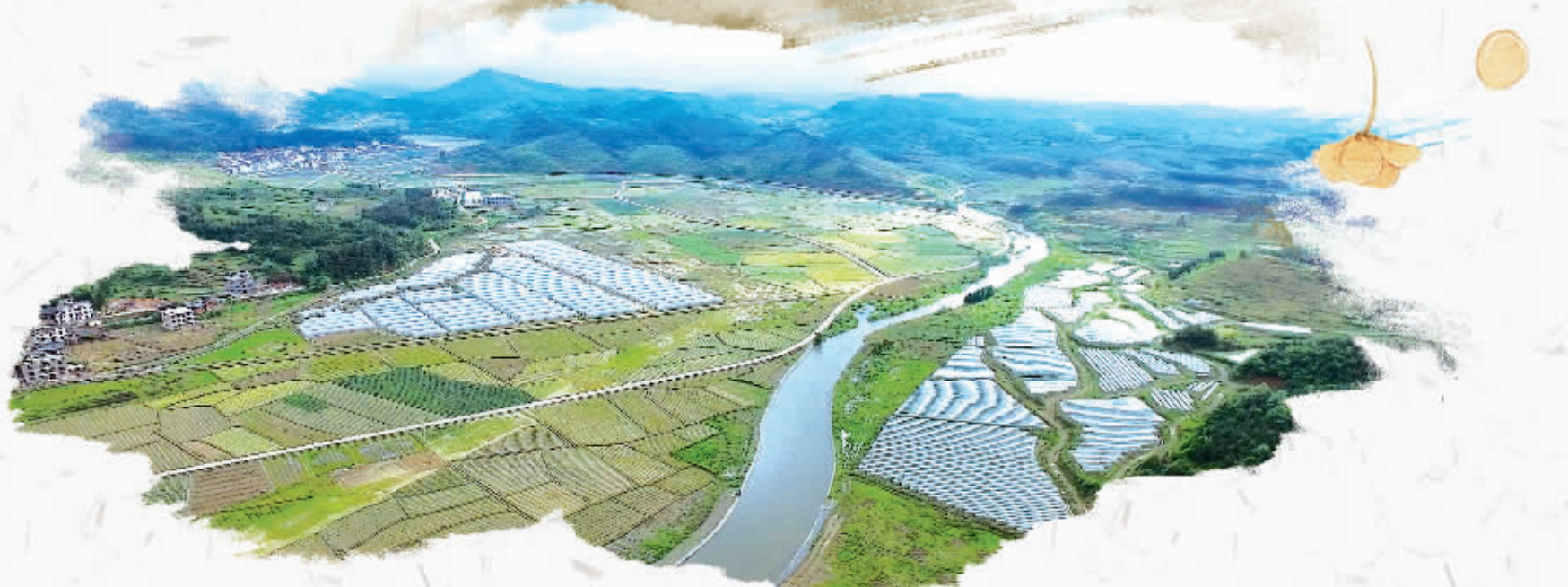
新田东升农场区域划分清晰的有机农田

永州自然环境优越、物产丰富，历来是农业大市。从2013年开始，在国家质检总局，以及湖南出入境检验检疫局、省商务厅、省农委等部门的大力支持下，永州市委、市政府紧紧围绕农业“走出去”战略，启动出口食品农产品质量安全示范区创建工作。近日，国家质检总局发布公告，永州正式成为国家级出口食品农产品质量安全示范市。“这是全国第四个、长江以南第一个国家级出口示范市，对于我省农业转型升级、供给侧结构性改革和扩大农产品出口具有重要的标志性意义。”湖南出入境检验检疫局局长杨杰表示。