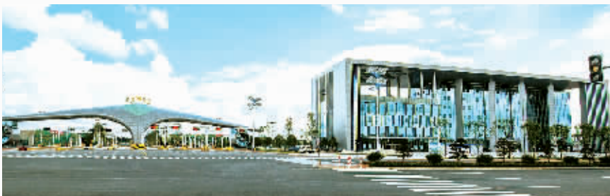
长沙黄花综合保税区封关运行

忽如一夜春风来，千树万树梨花开。从2013到2017年，重大产业项目个数从184个铺排到501个，年度预估投资从492亿元增长到1263亿元，规模越来越大，呈现出“爆发式”、“井喷式”发展态势，勾勒出长沙项目增长波澜壮阔的前行轨迹。