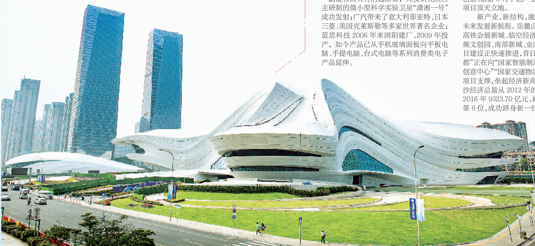
长沙梅溪湖国际文化艺术中心迎接参加“泛珠9+2行政首长会议”嘉宾。