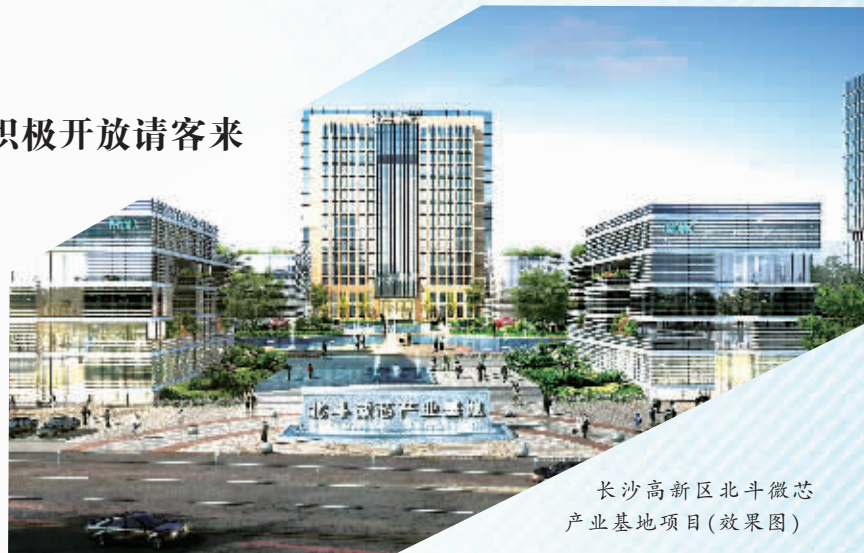
长沙高新区北斗微芯产业基地项目(效果图)

刷新速度的何止海利。长沙黄花综合保税区，从2016年9月进场施工到今年4月通过省级预验收，前后不过半年多时间；