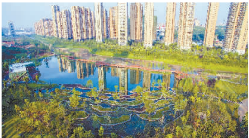
长沙市雨花区圭塘河生态景观区羽燕湖,各类水生植物生长茂盛。