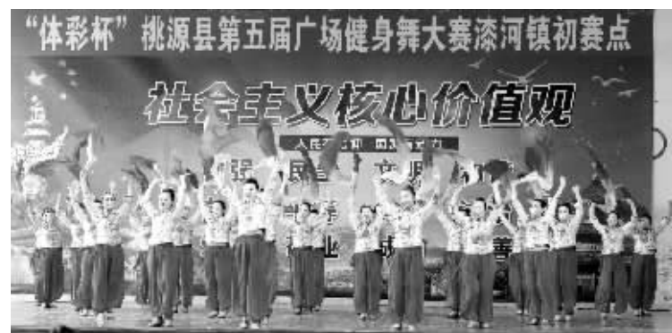
桃源县“体彩杯”广场舞大赛溇河镇初赛点比赛现场。

为繁荣和发展桃源县群众文化事业，由桃源县文体旅广新局主办的第五届“体彩杯”广场舞大赛经过两个多月的筹备宣传和发动，各乡镇和县直单位的积极参与，于7月16日完成了初赛。