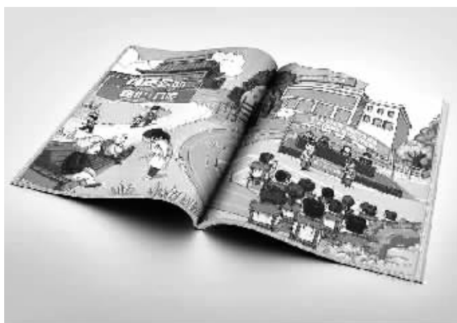
《2016年度湖南省福利彩票社会责任报告》。