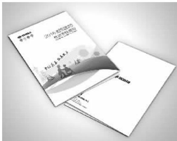
《2016年度湖南省福利彩票社会责任报告》。

2016年，湖南福彩共筹集公益金23.96亿元，省本级可分配使用4.4亿元，湖南省民政厅商同级财政部门同意，按照福利彩票“扶老、助残、救孤、济困”的发行宗旨和福彩