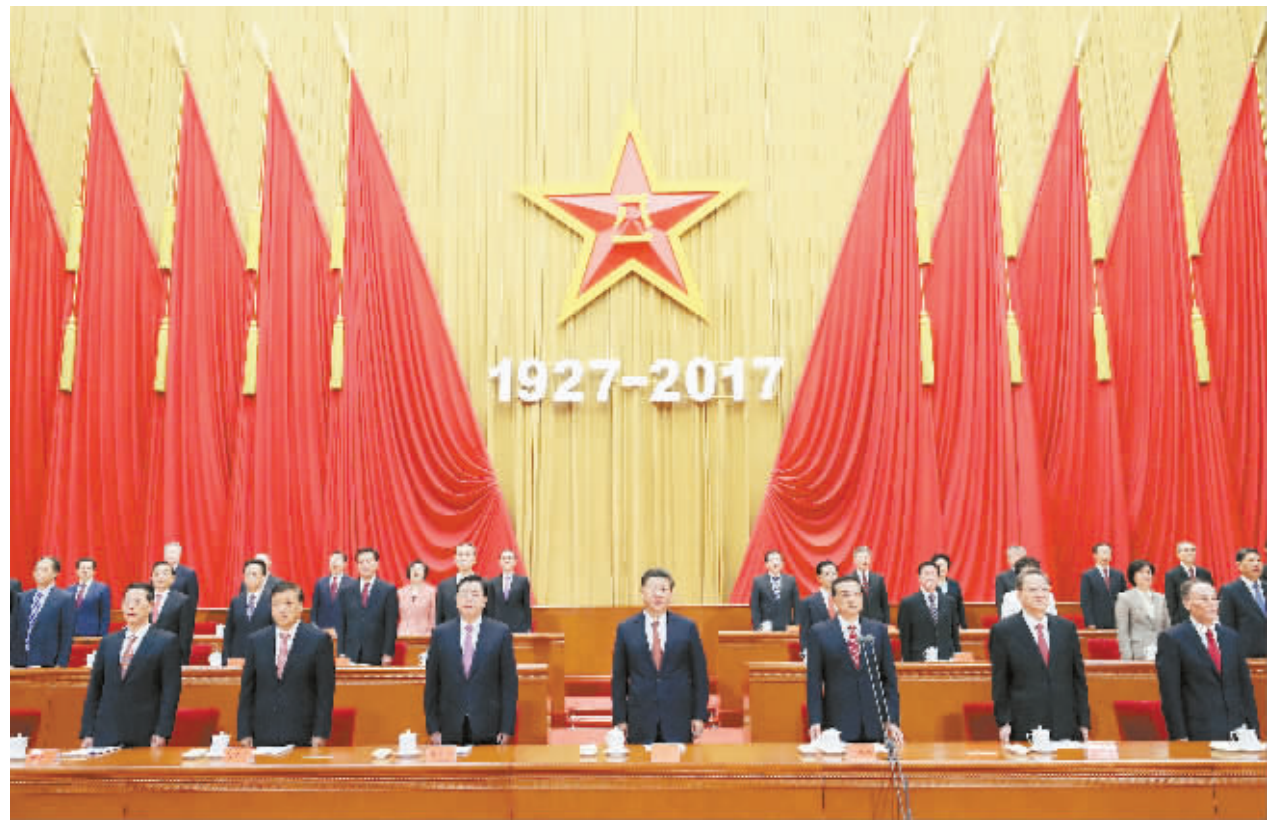
中共中央总书记、国家主席、中央军委主席习近平和李克强、张德江、俞正声、刘云山、王岐山、张高丽等出席大会。

新华社北京8月1日电 庆祝中国人民解放军建军90周年大会1日上午在北京人民大会堂隆重举行。中共中央总书记、国家主席、中央军委主席习近平在会上发表重要讲话强调,人民军队的历史辉煌,是鲜血生命铸就的,永远值得我们铭记。人民军队的历史经验,是艰辛探索得来的,永远需要我们弘扬。人民军队的历史发展,是忠诚担当推动的,永远激励我们向前。中华民族实现伟大复兴,中国人民实现更加美好生活,必须加快把人民军队建设成为世界一流军队。我们要不忘初心、继续前进,坚定不移走中国特色强军之路,把强军事业不断推向前进,努力实现党在