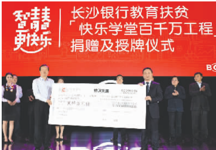
活动仪式现场，长沙银行向湖南省慈善总会捐赠项目资金2000万元。