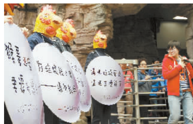
4月12日,武陵源百龙天梯中站平台,一排挂着环保宣传广告牌的“垃圾侠”吸引了游客关注。