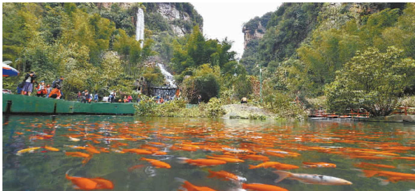
4月11日,张家界宝峰湖景区,湖面清波荡漾,鹅鸭戏水,鲤鱼翻跳。