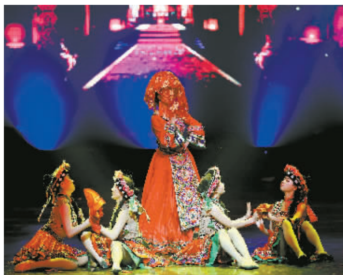
4月10日晚,“张家界·魅力湘西”精彩节目《女儿会》。被誉为“东方情人节”的土家女儿会,是土家族具有代表性的民族传统节日之一。

4月9日至14日,湖南第六届新闻研修班在这里举办。期间,学员们用他们的镜头摄取精彩瞬间,感知诗画武陵源。