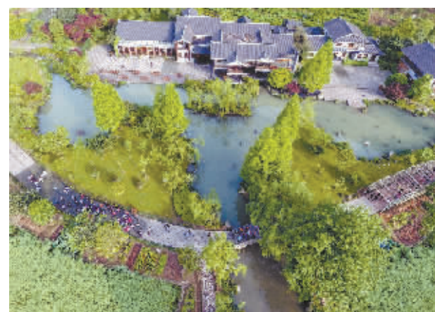
4月11日,武陵源黄龙洞景区生态休闲广场,浓密的垂柳,烂漫的春花构成诗意的春意图,吸引了众多游客前来踏春赏花。