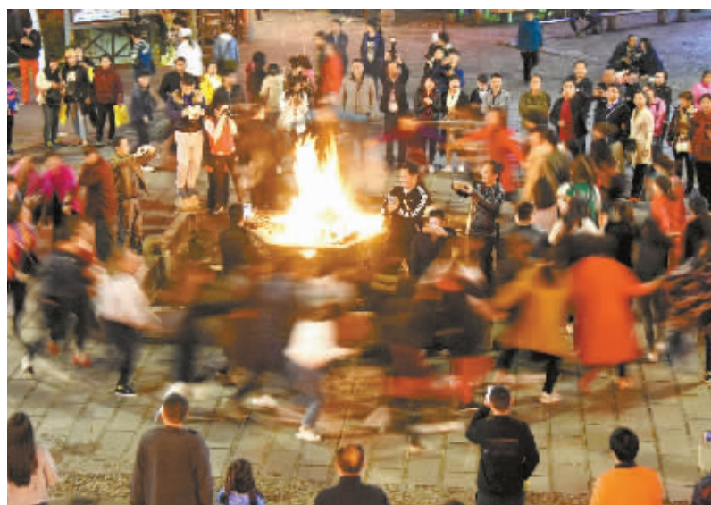
“摆摆摆,摆摆摆,摆起你的手来。”4月11日晚,武陵源溪布街的篝火晚会上,游客和土家阿哥阿妹齐跳摆手舞,欢乐的氛围蔓延开来。