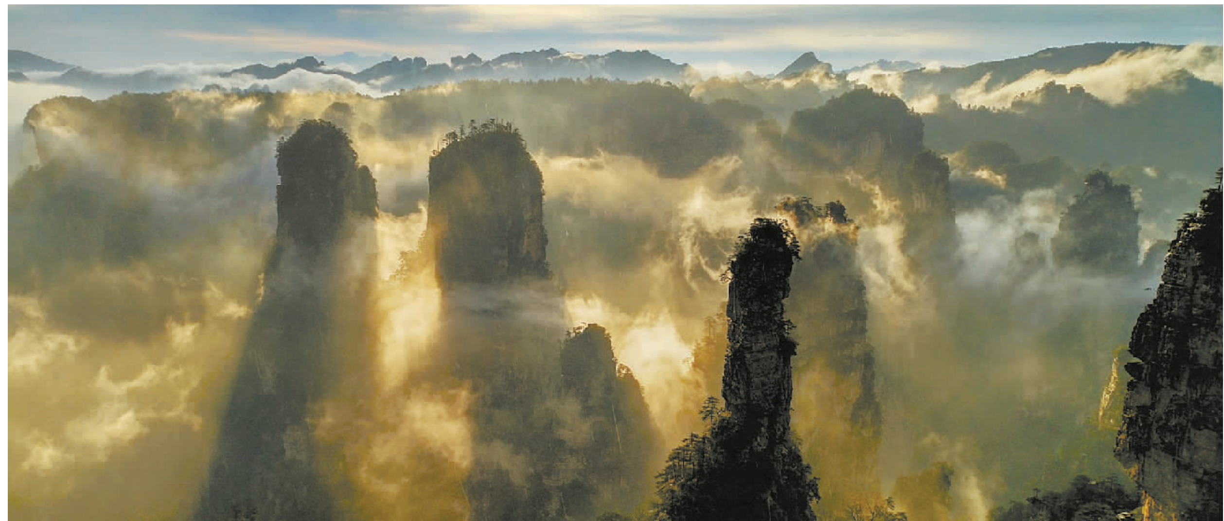
4月11日,张家界黄石寨云海景观。降雨“洗礼”后,连绵峰林与飘渺云雾构成一幅仙境般画卷。