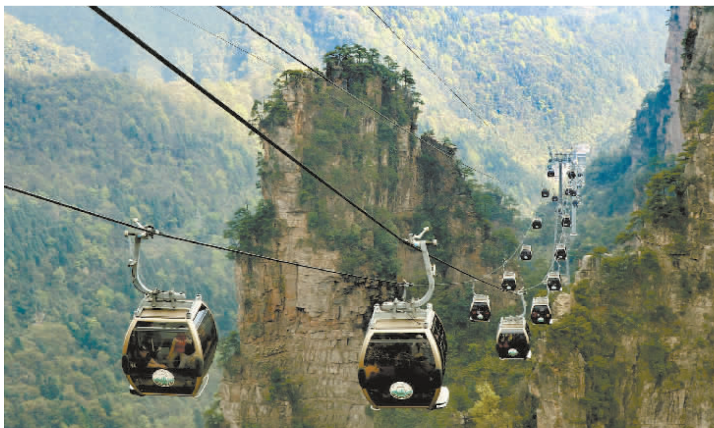
4月12日,天子山索道,缆车飞行,如入梦境。索道缆车是游客进入天子山景区的主要交通工具。