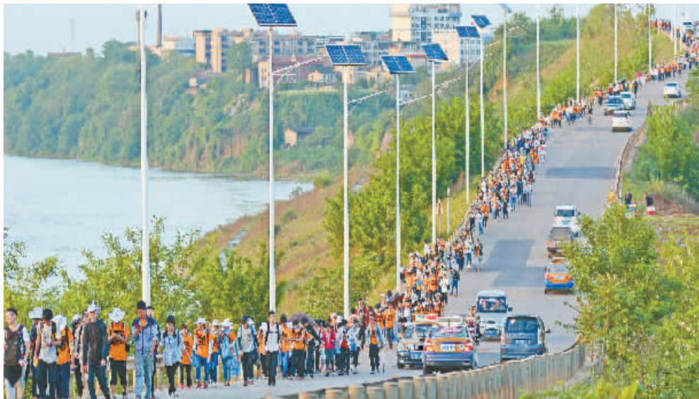
在4月16日进行的2016湖南百公里毅行活动中,万名勇士沿着湘江徒步前行。

2016年,全省山地户外运动大会计划设6站活动,岳阳湘阴青山岛将举办首站活动。去年尝到户外健身大会的“甜头”后,靖州准备再一次迎接来自全国各地的户外爱好者。