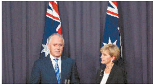
9月14日，在澳大利亚堪培拉，马尔科姆·特恩布尔(左)与澳大利亚外长毕晓普出席记者会。马尔科姆·特恩布尔14日晚赢得自由党党首投票，将取代阿博特担任澳大利亚总理。

新华社北京9月14日电 中办、国办日前印发《关于推动国有文化企业把社会效益放在首位、实现社会效益和经济效益相统一的指导意见》。意见强调，文化企业提供精神产品，传播思想信息，担负文化传承使命，必须始终坚持把社会效益放在首位、实现社会效益和经济效益相统一。