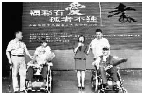
活动现场为两位高龄抗战老兵捐赠轮椅。

9月9日上午，湖南“福彩有爱·孤老不独”关爱帮扶贫困半失能老人集中捐赠暨总结表彰活动在长沙市东风剧院举行。中国福利彩票发行管理中心党委副书记兼纪委书记潘梓朝、省民政厅党组成员、省老龄工作委员会办公室主任陈毅华，以及省慈善总会办公室、省老龄事业发展基金会、省福彩中心、湖南电台潇湘之声频道有关负责人出席了捐赠活动。长沙市部分社区受助老人和爱心志愿者、长沙、株洲、湘潭、益阳“善行福彩”志愿服务队、省内各大主流媒体记者及14个市州评选出的“福彩公益之星”近400人参加了活动。来自长沙市部分社区的54位贫困半失能老人集中接收了由中国福利彩票捐赠的爱心轮椅。