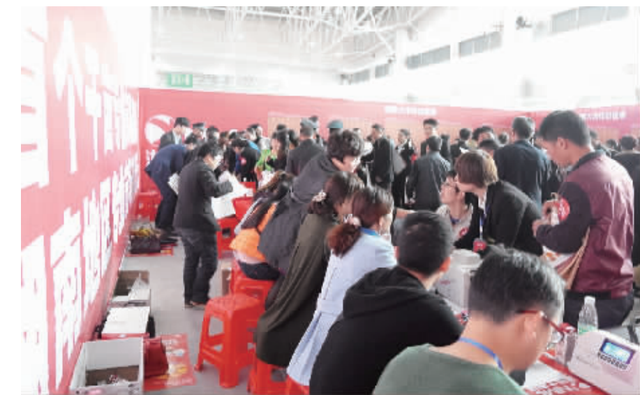
房交会时的认筹场面。