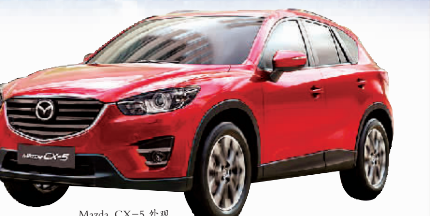
Mazda CX-5 外观

只要您到店试乘试驾并关注官微，即赠送“跑男”同款抱毯；只要您购车即可获得整车3M原厂贴膜(含工时费)；如果您是购买两厢车的女性用户更可获赠一年交强险；现在购买还有两年24个月的零手续费、零利息贷款支持；想换车的用户不用担心，长安马自达二手车置换更可立享3000元优惠补贴。 有理由相信，随着马自达“魂动”设计和“创驰蓝天”技术市场接受度的不断走高，CX-5、昂克赛拉这对“魂动双子”一定会将销量纪录不断刷新。长安马自达始终将您的需求放在首位，为您带来更多更好的产品和服务！