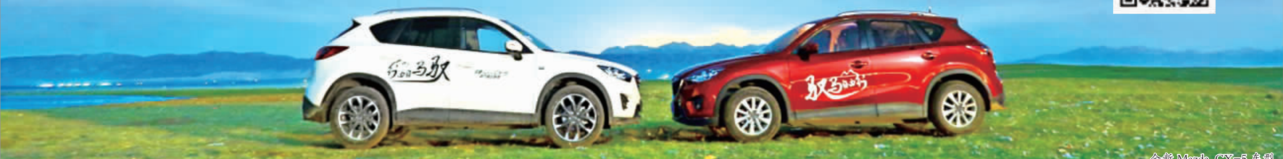
全新 Mazda CX-5 车型