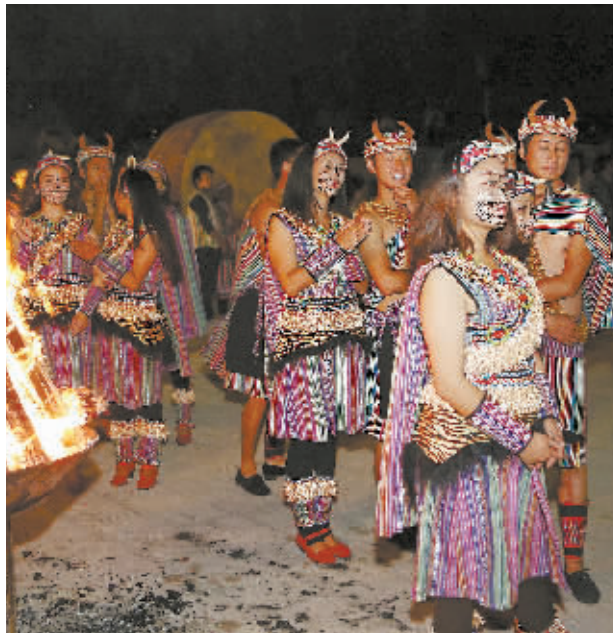
图左：脱贫致富的独龙族群众。图右：美丽的独龙族特色民居。

借他山之石，攻扶贫之坚。今天起，本报将连续刊发“精准扶贫奔小康·他山之石”系列报道，分别介绍贵州、云南、广西、河南、四川、甘肃等6个省区扶贫经验。