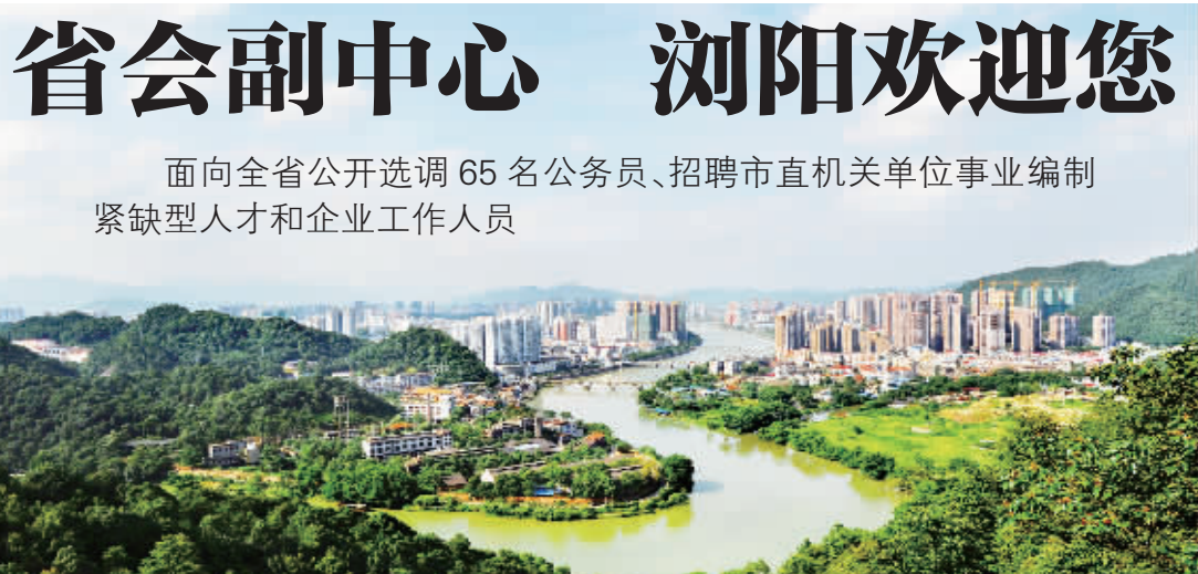
浏阳美景

浏阳地处湖南东部，面积5007平方公里，人口145万，是世界闻名的花炮之乡，是全国著名的将军之乡、诗词之乡、花木之乡。