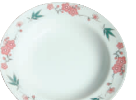
“毛瓷”——梅花画面菜盘

收藏有这种原料一定要保护好！这种原料做成的瓷器真的白如玉、薄如纸、明如镜、声如磬，可以说是大球泥成就了主席用瓷的温润如玉，没有大球泥就没有醴陵“毛瓷”。原来用大球泥生产的国宴用瓷和人民大会堂里的瓷器现在作为珍藏品收藏在了国家档案馆，可见它的价值有多珍贵。现在用大球泥生产釉下五彩瓷作为极品收藏瓷和高级艺术品绝对是好的，价值不菲！我活了八十几岁还真没看到用其他泥生产的瓷器超过大球泥做的瓷器。但我认为现在用大球泥生产高档艺术瓷器有些浪费，现代国防、航天航空等很多领域都需要这种极佳的原料。大球泥是无价之宝，