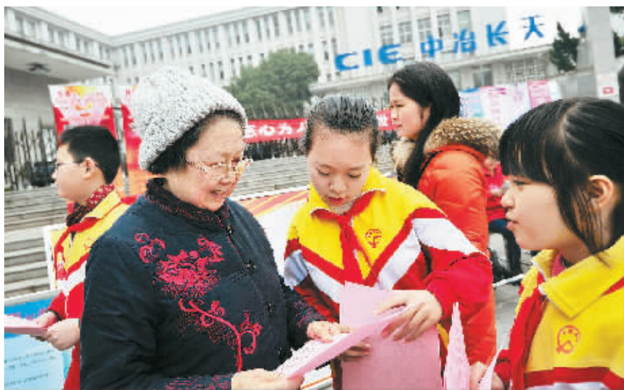
3月5日,长沙市东塘商业广场,阿弥岭社区小学生志愿者向过往市民发放并讲解“学雷锋活动倡议书”。长沙阿弥岭社区开展以“榜样引领导航,爱心陪伴成长”为主题的“蓓蕾行动”。提倡用语言、用行动、用友爱学习雷锋,做雷锋精神的传人。

据介绍,“爱心顺风车”活动向全区的机关干部、社区爱心人士倡议,利用私家车的空位,为有需要的市民出行提供交通便利,缓解交通拥堵、倡导绿色出行,用爱心和真情温暖社会。短短几天,已有300余名爱心车主加入,每天至少发布50余条顺风车信息。