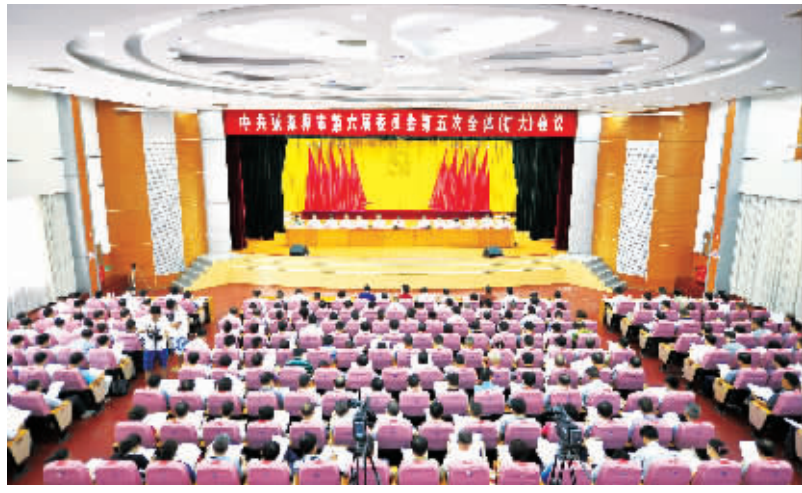
动六 二〇一三年七月三十日，中共张家界市委、市政府召开全市提质升级大会，杨光荣书记在会上发表讲话。

张家界是一张美丽中国的靓丽名片。在这块约占中国国土面积千分之一的土地上，集中了峰林、峡谷、溶洞、温泉、湖泊、溪流、原始森林、名胜古迹等资源，是世界罕见的旅游资源富集之地，现有各类景区景点300多个，其中国家级旅游区18处，包含5A级景区5处、4A级景区7处。从莽在深到誉满天下，张家界先后摘取了中国第一个国家森林公园、中国首批世界自然遗产、世界特色魅力200强、世界首批地质公园、全国首批5A级景区、全国文明风景区、中国优秀旅游城市以及最佳旅游目的地、中国最具海外影响力城市等一系列国内国际顶级的旅游品牌，被列为全国首批旅游综合改革试点城市，成为中外游客心驰神往的旅游目的地。2013年，全市各景点接待中外游客3440万人次，实现旅游收入212亿元。