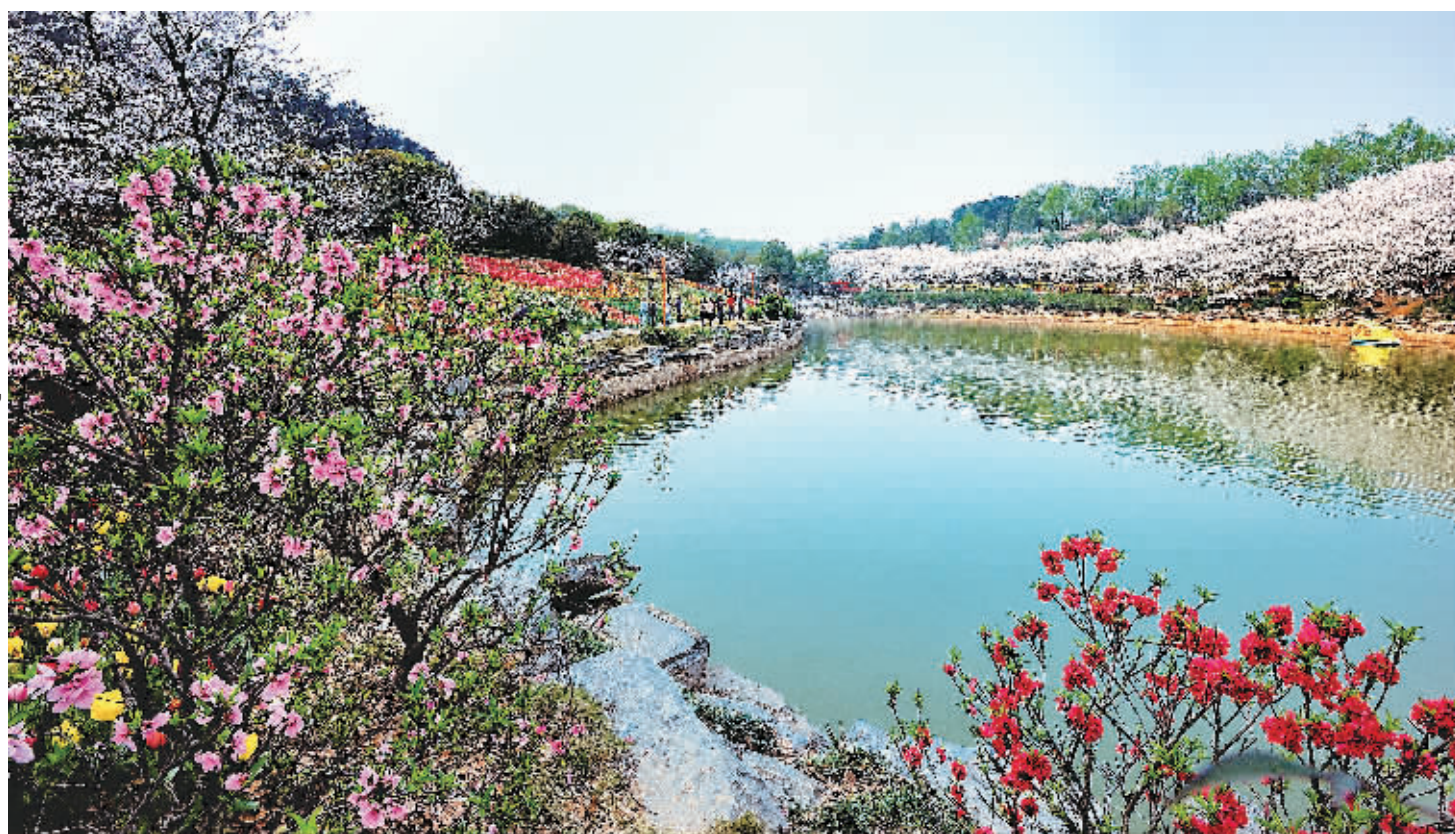
国家4A级旅游景区——湖南省森林植物园