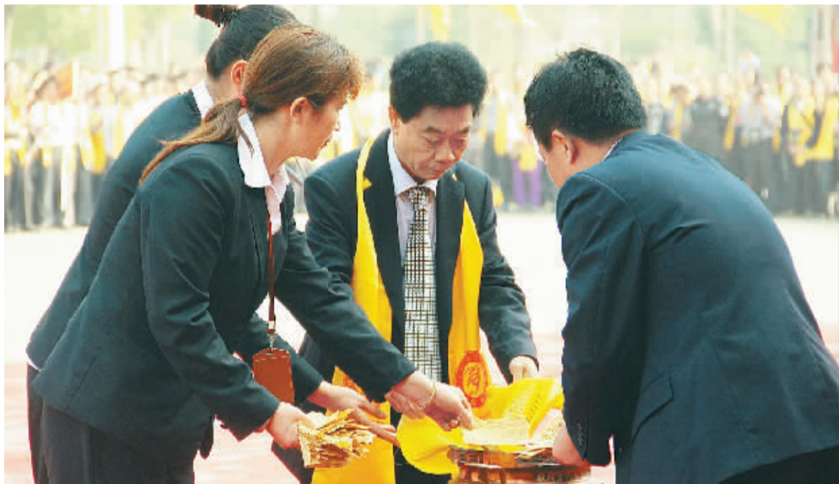
11月6日,宁远县九疑山舜帝陵,世界姚氏宗亲联谊会举行以“放飞梦想、奔向世界、弘扬舜德、振兴中华”为主题的首届公祭舜帝大典,来自新加坡、泰国、美国、菲律宾、香港等10多个国家和地区及国内20多个省、市、自治区的姚氏宗亲代表2200余人,一同参与祭拜,共怀始祖舜帝。