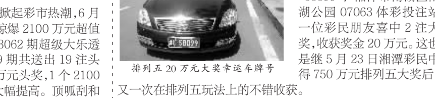
排列五20万元大奖幸运车牌号

6月13日,体彩排列五第13157期开奖号码为“58899”,湘潭市雨湖区南湖公园07063体彩投注站一位彩民朋友喜中2注大奖,收获奖金20万元。这也是继5月23日湘潭彩民中得750万元排列五大奖后,又一次在排列五玩法上的不错收获。