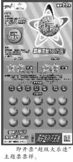
即开票“超级大乐透”主题票票样。

提及体育彩票,相信很多人会首先想到超级大乐透、足彩或是顶呱刮,这就是品牌效应。近日,这些在体彩领域盛名多年的品牌玩法也开始成为即开票的主题元素,以体彩品牌家族游戏的身份在即开票的票面上亮相! “顶呱刮”和“超级大乐透”是本次最新推出的即开型体育彩票,两款票以品牌家族的身份亮相,不仅独特而又充满新意。而其组合推出的5元、10元和20元三个