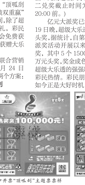
即开票“顶呱刮”主题票票样

21日在全国范围内开展主题为“顶呱刮&超级大乐透周年庆,感恩回馈双重赢”的联合营销推广活动。活动期间,除了超级大乐透每期500万的派奖大礼,彩民一旦中大乐透游戏彩票即有机会免费获赠顶呱刮彩票,或者中顶呱刮可获赠大乐透彩票。