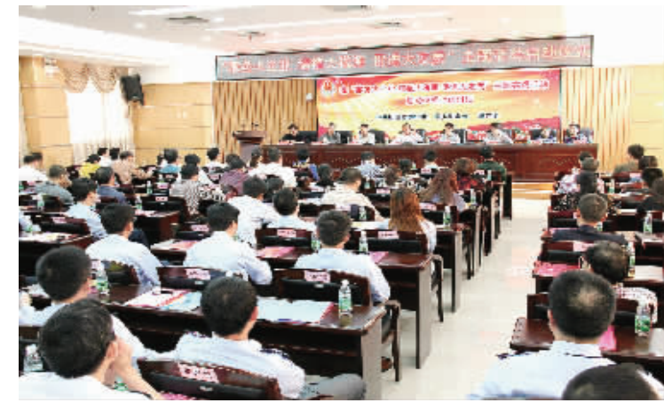
4月18日，衡阳市国税局启动“服务大企业 培植大税源 促进大发展”主题实践活动。