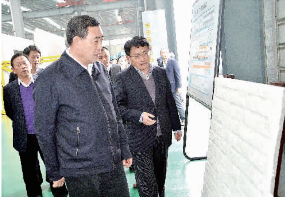
4月1日，省国税局党组书记、局长丁永安在远大住工调研了解企业涉税需求。

“《保障办法》有利于切实保障湖南省的财政收入，有利于维护税权统一和权威，使湖南省在优化税收环境，完善税收制度，推动税制改革等方面取得积极进展，促进结构优化和社会公平，推动科学发展和社会和谐。”省财政厅党组书记、厅长史耀斌的话，一语中的。此次出台的《保障办法》，核心内容是对征管法第五条中政府